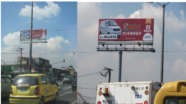
VISTA PANORÁMICA DEL ELEMENTO DE PUBLICIDAD EXTERIOR VISUAL TIPO VALLA TUBULAR COMERCIAL INSTALADO – SENTIDO NORTE - SUR: Q'HUBO